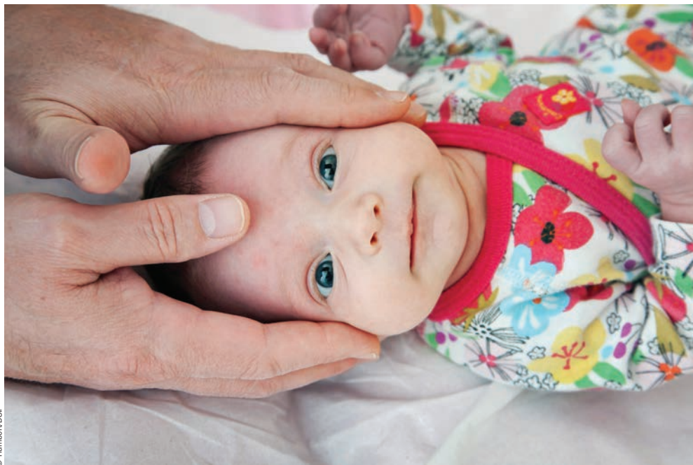
L'ostéopathe considère attentivement la manifestation première de la vie, c'est-à-dire le mouvement, dans les tissus qu'il palpe.